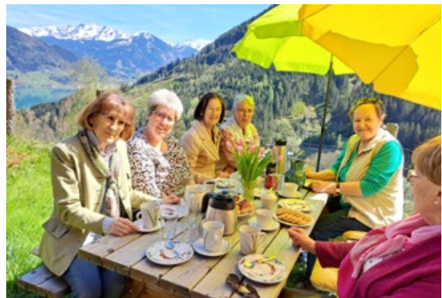
Das Team des Weltgebetstags bei der Nachbesprechung

05.09., Klosterleben - auch mitten in der Welt. Katholische und evangelische kommunale Gemeinschaften.