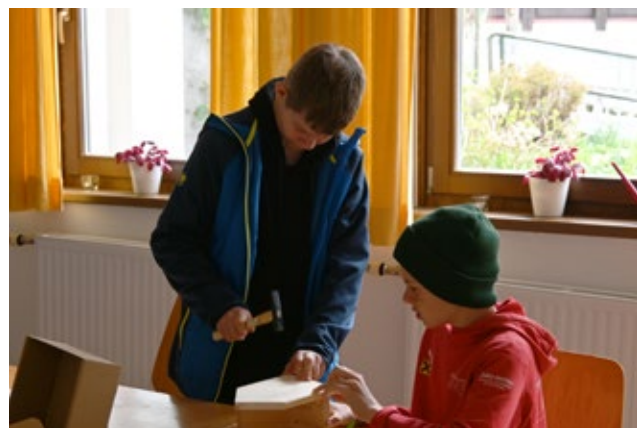
Beim letzten Treffen unserer Konfirmandinnen und Konfirmanden ging es auch um das Thema Schöpfung. Dazu wurden Nistkästen gebastelt